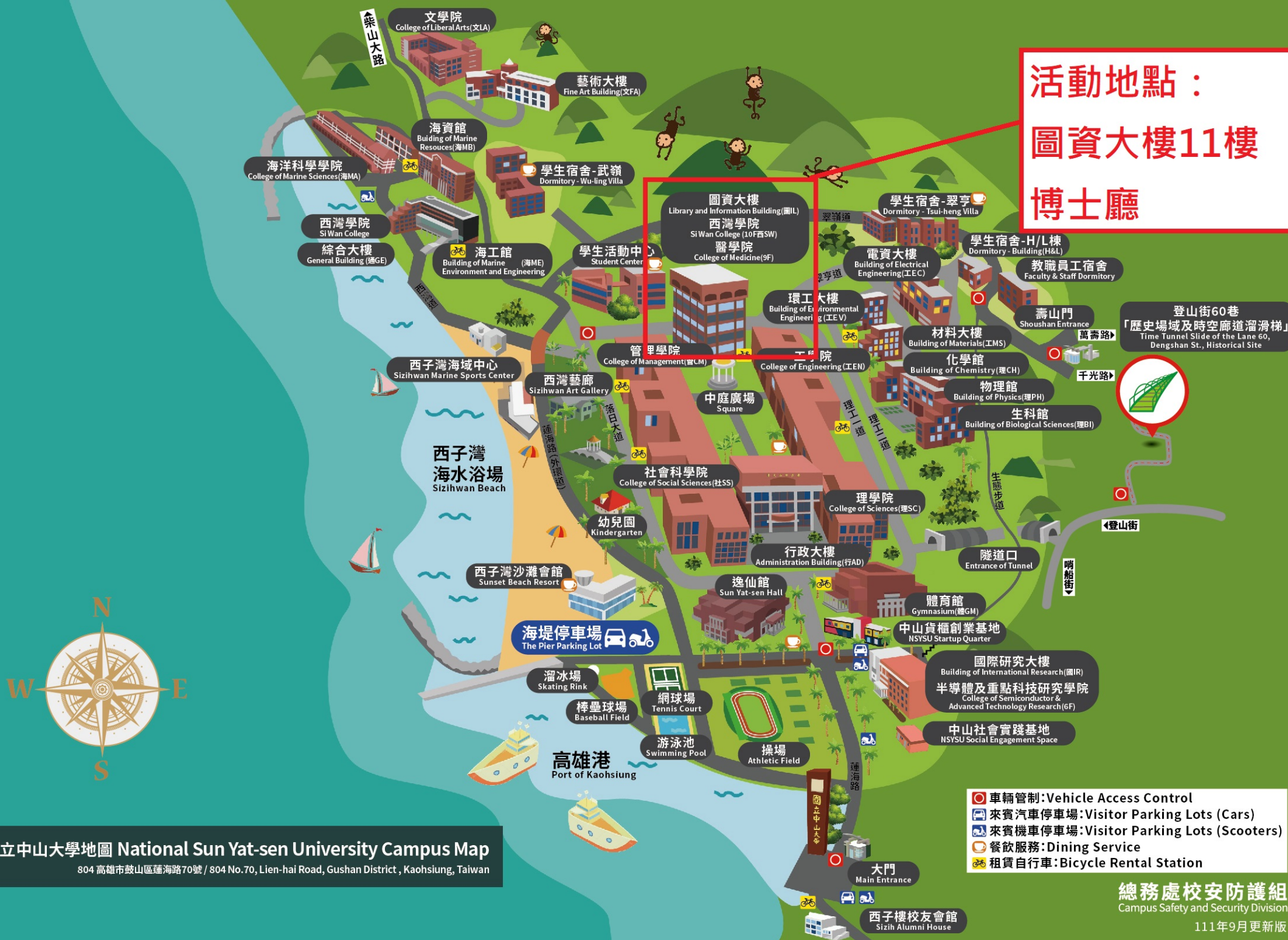
國立中山大學地圖 National Sun Yat-sen University Campus Map

804 高雄市鼓山區蓮海路70號 / 804 No.70, Lien-hai Road, Gushan District, Kaohsiung, Taiwan